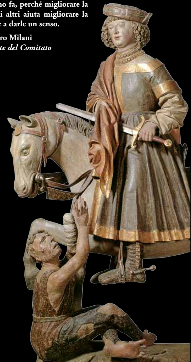
Artista svevo del XV secolo San Martino a cavallo 1470 circa